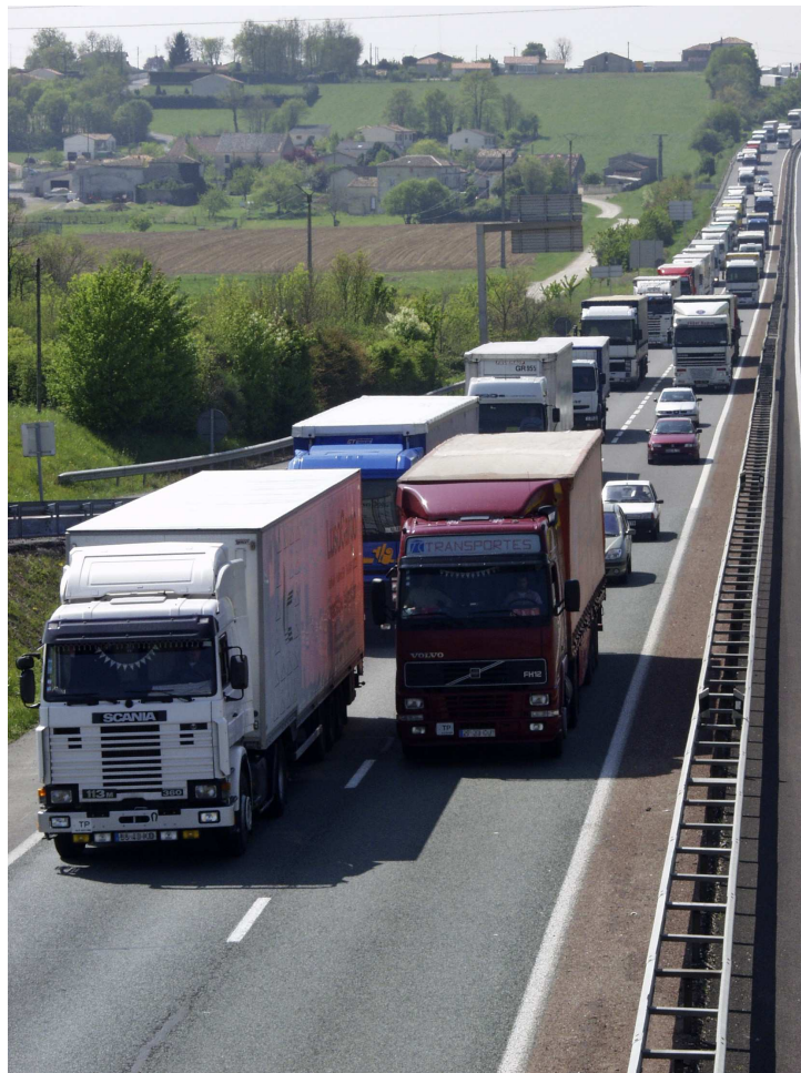
Photo prise le long de la RN10